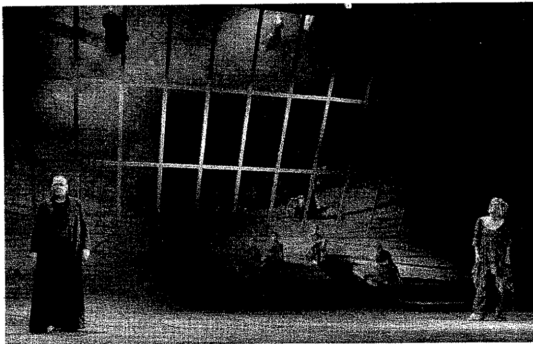
Medea in een schitterend decor van Tom Schenk